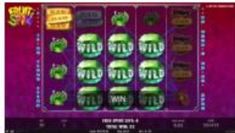
3x3 Wild symbols