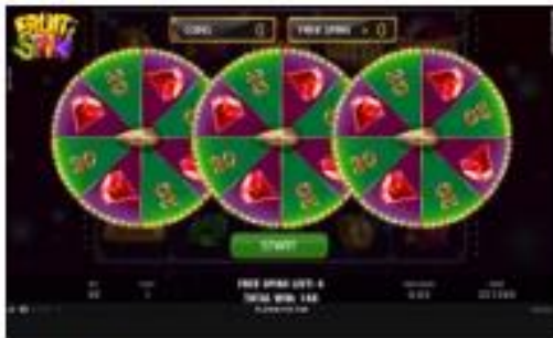
Lucky Wheels in Free Spins

Papildu opcija – Free Spins jeb gājieni par brīvu