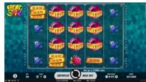
3x3 Scatter symbols