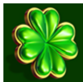
Īpašais simbols “Clover” ar izplešanās papildfunkciju

laimestu par abiem, jo izkaisītajam simbolam nav jāatrodas uz secīgiem ruļļiem, lai iegūtu laimests.